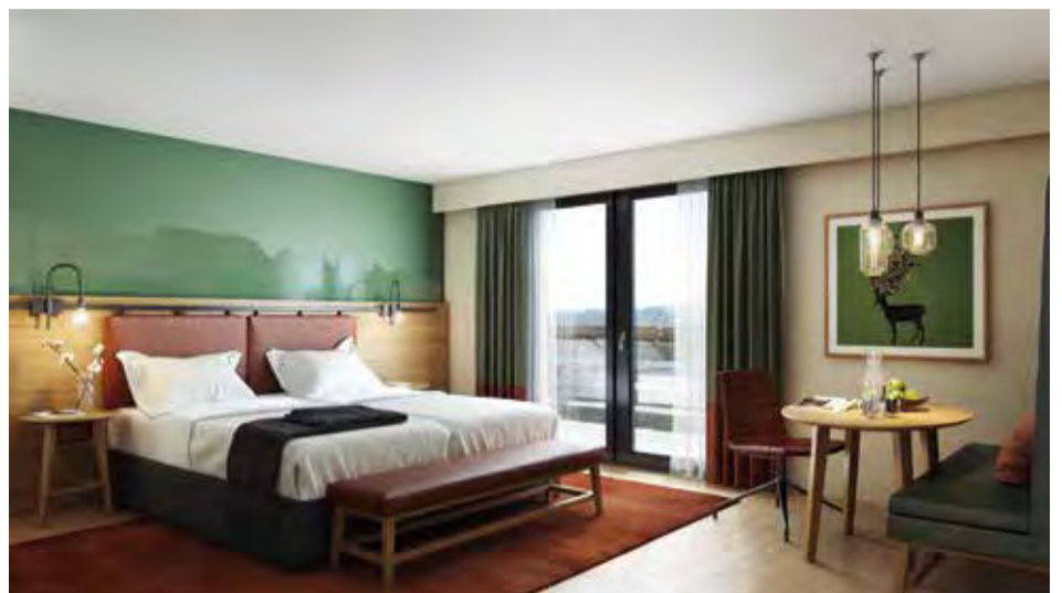
Visualisierung der neuen Zimmer

Durch die Schweizer Fernsehsendungen «Tapetenwechsel» und «Happy Day» ist Andrin Schweizer einem breiten Publikum bekannt.